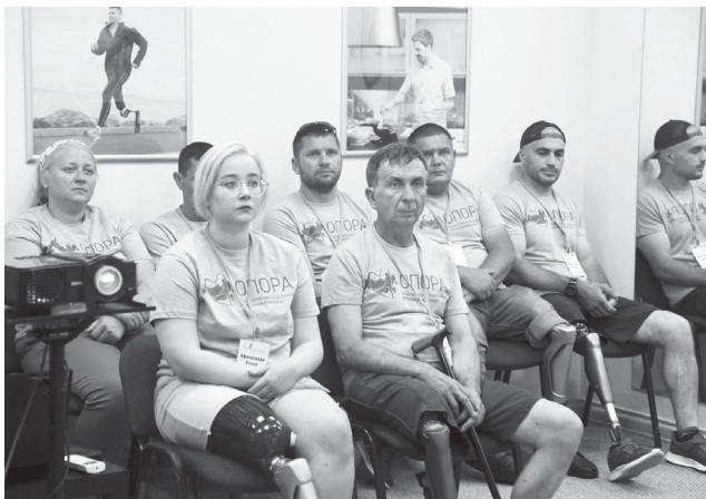
Участники мастер-класса узнали много нужной и полезной им информации

А ребята-паралимпийцы, которых отстранили, они ведь и в этот раз победили. Помните, с каким удовольствием парни