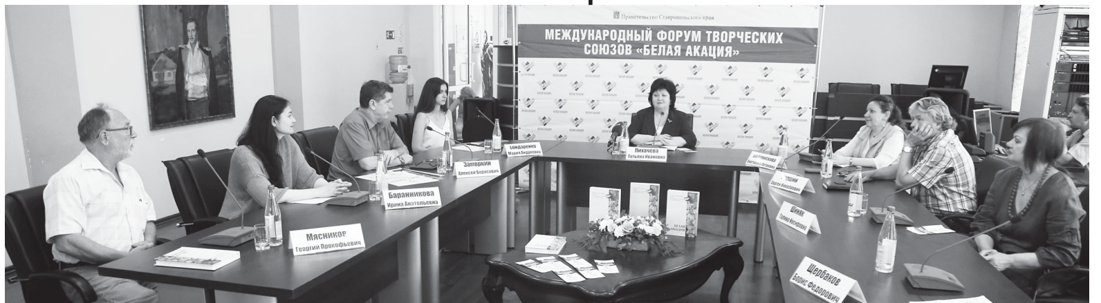
Участники пресс-конференции, посвященной VII Международному форуму творческих союзов «Белая акация»

В программе форума очень активно задействована площадка Ставропольского краевого театра кукол. Здесь будут проходить не только мастер-классы, организованные Союзом театральных деятелей РФ, но также проекты Союза кинематографистов РФ. 13 июня на площадке запланированы презентация проекта «Лаборатория игрового кино и сериалов» Фонда поддержки регионального кинематографа Союза кинематографистов России и мастер-класс